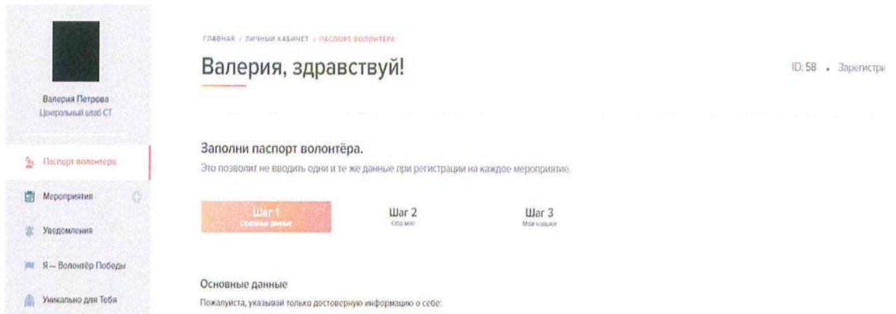
Рисунок 9 – Скриншот личного кабинета, где можно найти разные разделы

2.2. После регистрации необходимо авторизоваться, если это не произошло автоматически. В личном кабинете на сайте волонтерыпобеды.рф необходимо перейти в раздел «Мероприятия» (рис. 9), найти необходимое мероприятие – Всероссийская акция «Сад памяти» – и нажать кнопку «Узнать подробности и записаться» (рис. 10).