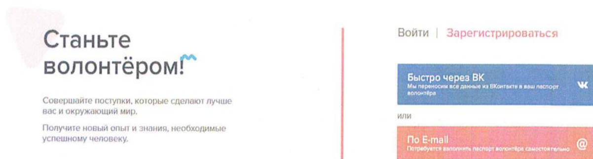
Рисунок 1 – Страница выбора способа регистрации на сайте волонтерыпобеды.рф

1.1. Регистрация на сайте волонтерыпобеды.рф. Зарегистрироваться в информационной системе можно двумя способами: с помощью социальной сети «ВКонтакте», с помощью электронной почты (рис. 1).