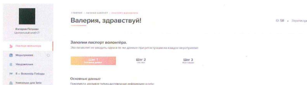
Рисунок 2 – Скриншот личного кабинета, где можно найти разные разделы

1.2. После регистрации необходимо авторизоваться, если это не произошло автоматически. В личном кабинете на сайте волонтерыпобеды.рф необходимо перейти в раздел «Мероприятия» (рис. 2), найти необходимое мероприятие – Всероссийская акция «Сад памяти» – и нажать кнопку «Узнать подробности и записаться» (рис. 3).