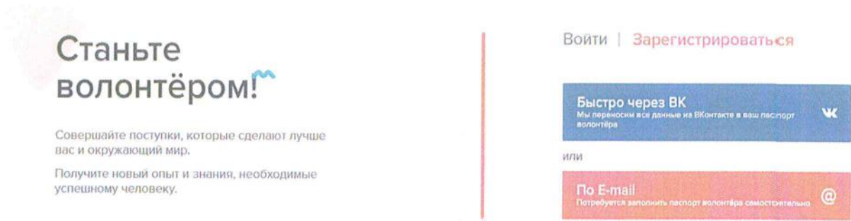
Рисунок 8 – Страница выбора способа регистрации на сайте волонтерыпобеды.рф

2.2. После регистрации необходимо авторизоваться, если это не произошло автоматически. В личном кабинете на сайте волонтерыпобеды.рф необходимо перейти в раздел «Мероприятия» (рис. 9), найти необходимое мероприятие – Всероссийская акция «Сад памяти» – и нажать кнопку «Узнать подробности и записаться» (рис. 10).