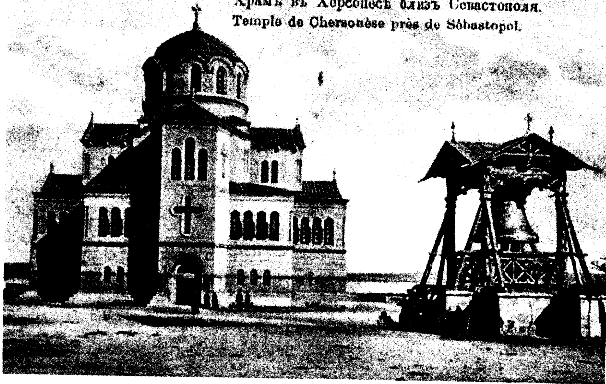
Храмъ въ Херсонесѣ близъ Севастополя. Temple de Chersonèse près de Sébastopol.