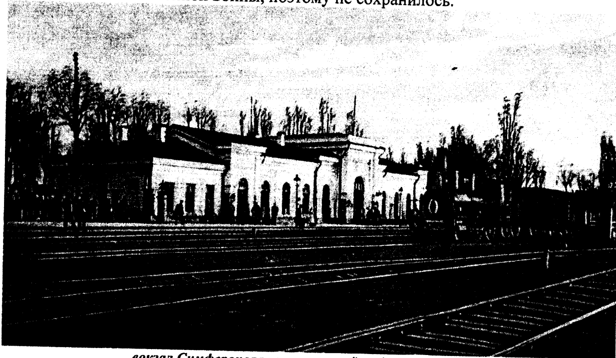
вокзал Симферополя, построенный на деньги Губонина

Первый железнодорожный вокзал Симферополя построен на деньги Петра Губонина, это его дар Симферополю. За свои заслуги он получил от городской думы звание «почетный житель Симферополя». Здание вокзала было сильно повреждено в годы Великой Отечественной войны, поэтому не сохранилось.